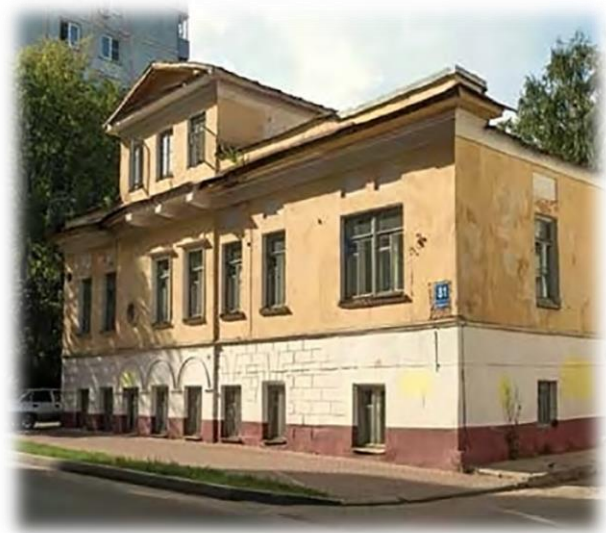
Рисунок 1 Дом Н. И. Васильева в Калуге. 1832 г. (перестроен в 1839 и 1857 гг.)

В кругу общения Никанора Ивановича было много творческих людей. И на протяжении всей жизни он увлекался коллекционированием предметов искусства. Сбирать художественные произведения начал в зрелом возрасте, под влиянием своего нижегородского окружения, и со временем увлечение стало занимать большое место в его жизни. Для своей коллекции он отвел отдельное помещение на первом этаже своего Калужского дома. Помимо картин и