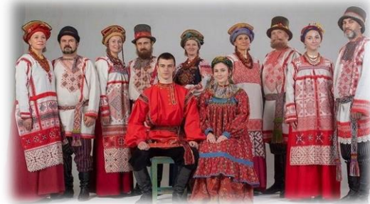
Пример русского народного костюма

Якутский костюм формировался с учётом сурового климата. Выделяли три вида: повседневный (для работы, охоты, поездки), ритуально - обрядовый (шаманский, свадебный) и другие. Ритуально-обрядовый шили из кожи, шёлка с декоративными вставками из металла, подвесками.[2]