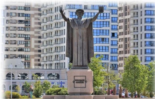
Рис.1. Памятник Франциско Скорины в Минске, у Национальной библиотеки Беларуси

Как выходец из восточнославянской среды, Скорина называл русский язык родным и способствовал просвещению всего восточнославянского мира, включая предков русских. Его издания сочетали традиции белорусского и восточнославянского искусства с европейским опытом книгопечатания, повлияв на развитие типографики и гуманистических идей в Русском государстве. Деятельность Скорины стала предтечей русского книгопечатания Ивана Федорова, обогащая общую славянскую культурную традицию.