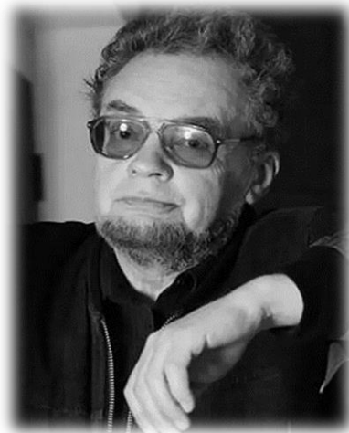
Рис.1. В.П. Маслов