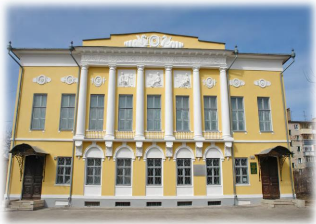
Рисунок 3. Городская усадьба Билибиных — Чистоклетовых. Фасад главного дома