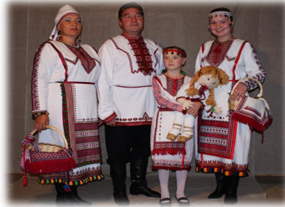
Рисунок 1. Праздничный традиционный костюм народа мари

Марийцы соблюдают свою национальную традицию, обряды, чтут память предков, отмечают национальные праздники. Традиции марийского народа уходят корнями в далёкое прошлое. Языческие культы марийцев тесно связаны с лесом и деревьями. Поклонение силам природы занимает центральное место в культуре мари. Своим богам они молятся в священных рощах. С древних времен в Республике Марий Эл их сохранилось более 300. Самыми почитаемыми деревьями считаются береза и рябина. В качестве тотемных животных издавна почитались медведь, лось и водоплавающая птица. Что заботило, радовало и тревожило марийский народ – всё это воплощалось в образах традиционной культуры и передавалось детям, внукам. Незаметно для себя буквально с младенчества человек входил в пространство этнической культуры, где эстетика народного костюма была средством социальной организации.