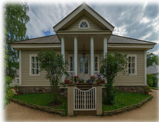
Фото 1. Усадьба Михайловское

Основные мероприятия включают торжественный митинг у памятника Пушкину в Михайловском, возложение цветов на могилу поэта в Святогорском монастыре, поэтические чтения, концерты классической музыки и романсов, исторические реконструкции эпохи XIX века, выставки народных промыслов и книжные ярмарки. Особое внимание уделяется участию молодёжи: школьники читают стихи наизусть, участвуют в литературных викторинах, пишут сочинения. Это способствует не только сохранению культурной памяти, но и пробуждению интереса к русскому языку и литературе.