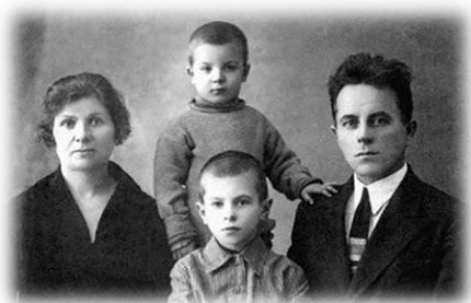
Рис.1. Семья Алфёровых