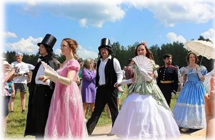
Фото 2. Праздничные мероприятия в дни Пушкинской поэзии

Огромный вклад в развитие современного формата праздника внесли владельцы заповедника «Михайловское». Именно под их руководством торжества превратились из формальных литературных чтений в истинно народное, масштабное действо, объединяющее высокую культуру и фольклорные традиции.