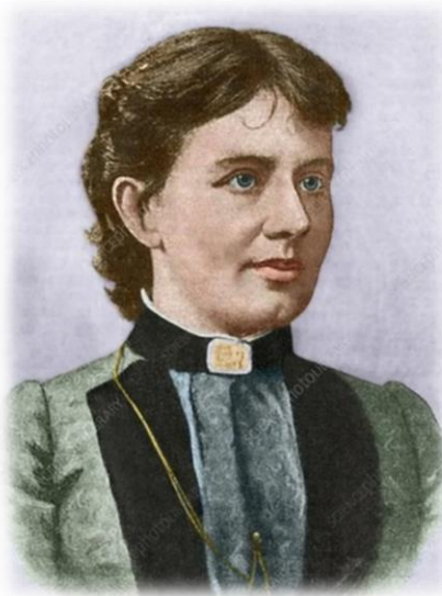
Рис.1. Ковалевская С.В.

Так ли это было на самом деле или нет, но интерес к математике девочка действительно проявила очень рано. Со своим обожаемым дядей, старшим братом отца, она любила болтать о всякой всячине: ну, например, о квадратуре круга и асимптоте. Именно от него она впервые услышала об этих математических терминах.