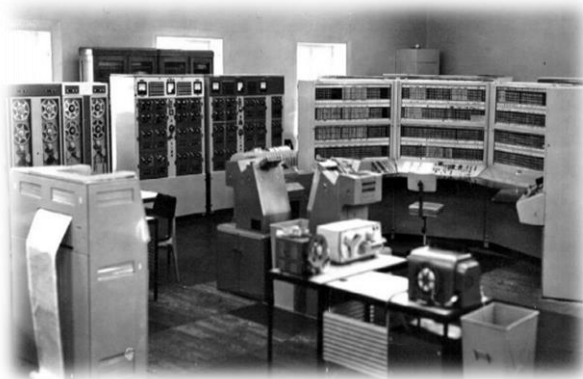
Рис.2. БЭСМ-6 – первый советский суперкомпьютер, 1967 г.

Деятельность С.А. Лебедева неразрывно связана с историей российской науки как коллективного многонационального достижения. Первую ЭВМ он создал на Украине – в Киеве, объединив вокруг себя учёных и инженеров Украинской и Российской советских