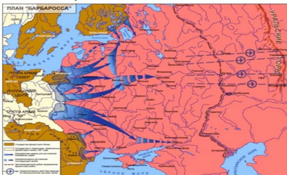
Рис.1. План «Барбаросса»

Продвижение немецких войск к южным границам СССР очень обеспокоило Кремль, проводимые Германией мероприятия по маскировке и дезинформации русских дал своих результаты. Сталин настолько уверовал, что нападения Гитлера в 1941 г. не произойдёт, что все предупреждения о готовящемся вторжении рассматривал как провокации. Между тем, 18 декабря 1940 г. Гитлер окончательно утвердил план «Барбаросса», основанный на тактике «блицкрига», и отводивший на русскую кампанию 6 недель: «Германские вооруженные силы должны быть готовы разбить Советскую Россию в ходе кратковременной кампании ещё до того, как будет закончена война против Англии.