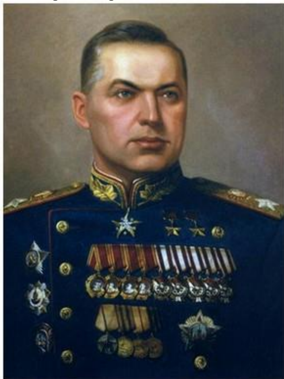
Маршал Советского Союза К.К. Рокоссовский

Стратегическое мышление во время войны отличалось гибкостью и адаптацией. Советские полководцы, такие как Г.К. Жуков и К.К. Рокоссовский, сумели переосмыслить тактику после первых поражений.