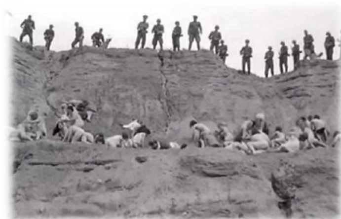
Рис.1. Уничтожение мирного населения. Бабий Яр

Утром 22 марта 1943 года подразделение 118-го полицейского охранного батальона в Минской области советской Белоруссии попало в засаду, устроенную партизанской бригадой «Дяди Васи» – Василия Воронянского. В ходе сопротивления было убито несколько солдат и любимчик самого Адольфа Гитлера – чемпион берлинской Олимпиады 1936 года по толканию ядра гауптман Ганс Вельке.