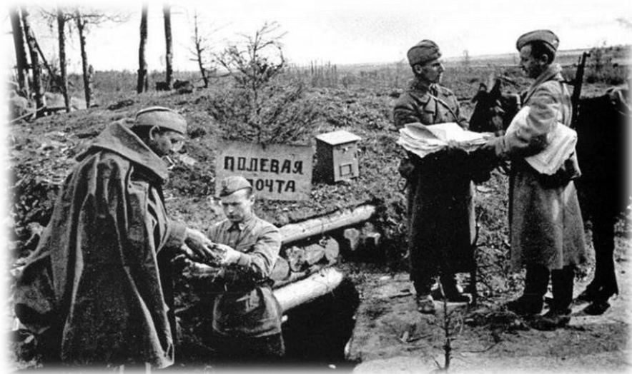
Рис.2. Полевая почта

Уже в конце 1941 года советская почта работала как часы. Ежемесячно на фронт доставлялось более 70 миллионов писем. На каждом письме или открытке ставились штампы «Письмо красноармейца» и «Доставка бесплатно».