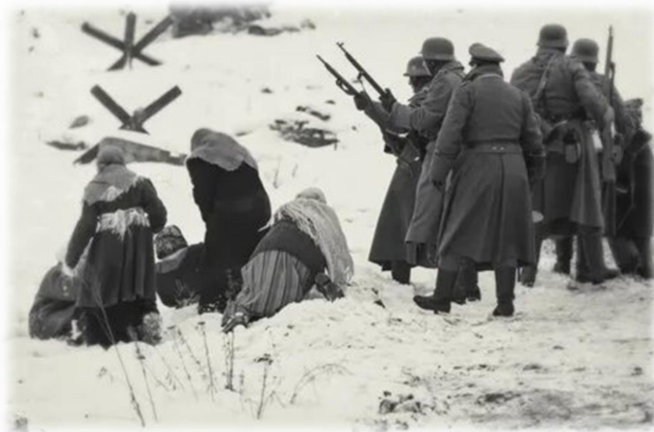
Рис. 1 - Расстрел

Число жертв оккупации исчисляется миллионами. Только в ходе Холокоста погибли около 2,7 млн советских евреев. Мирное население также подвергалось массовым расстрелам и депортациям.