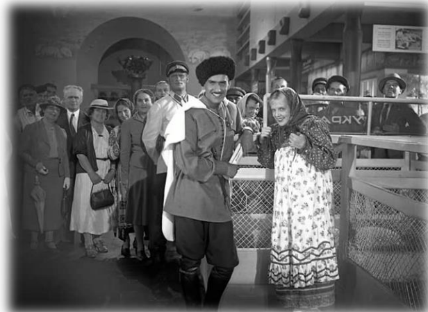
Исполнители главных ролей Марина Ладынина и Владимир Зельдин на съемках фильма «Свинарка и пастух», 1941 год