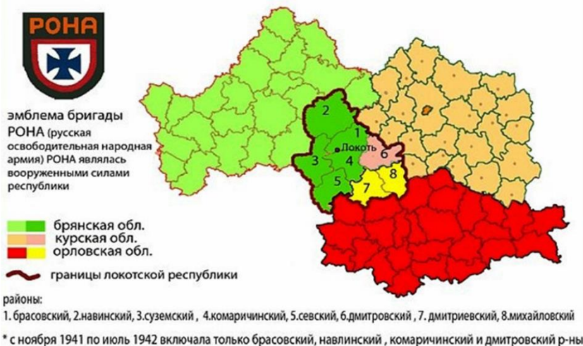
Рис.1. Карта Локотской республики

В поселок Локоть немецкие войска вошли 4 октября; в тот же день им предложили свои услуги преподаватель физики в местном техникуме Константин Воскобойник и инженер Локотского спиртзавода Бронислав Каминский. Предложенные услуги были приняты: Воскобойник был назначен старостой Локотского волостного управления, а Каминский – его заместителем. При управлении разрешалось иметь вооруженный винтовками отряд «народной милиции» численностью 20 человек. Через две недели, 16 октября, оккупанты разрешили Воскобойнику увеличить отряд «народной милиции» до 200 человек, а в деревнях создать так называемые группы самообороны.