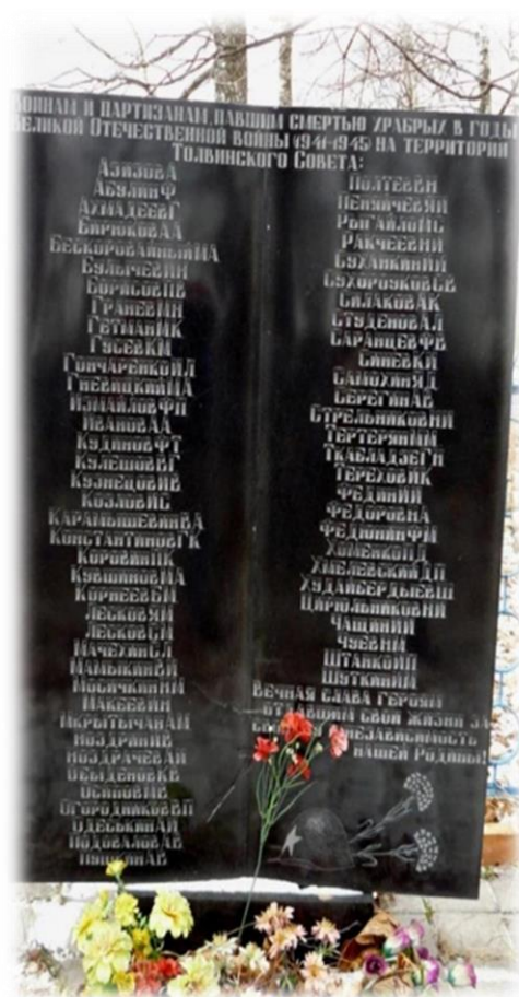
Памятник погибшим односельчанам

Почти 80 лет назад закончилась Великая война, но не все извлекли из неё уроки, вновь слышны в мире её отголоски. И современная война- это боль, страдания и потери. Мы, как и дети тех далёких, сороковых, ждём добрых вестей из зоны СВО, ждём домой наших военнослужащих и верим в нашу Победу!