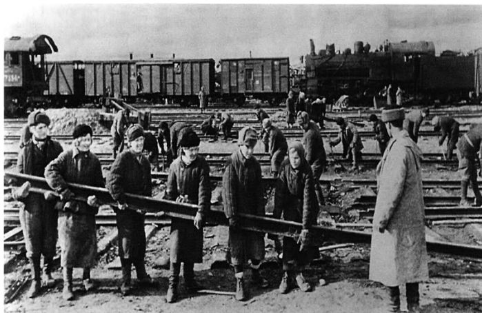
Рис.2. Волжская рокада – один из самых масштабных проектов СССР в годы Великой Отечественной войны

Железная дорога в целом играла важную роль во время войны.