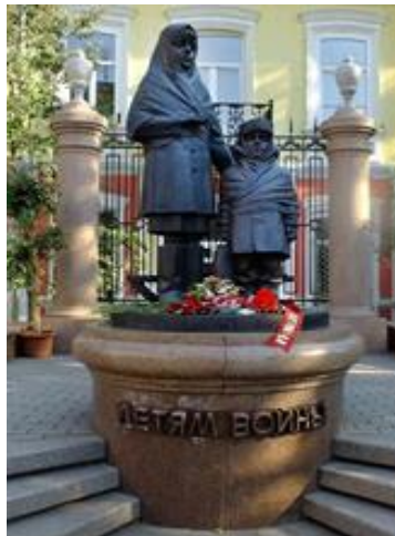
Памятник детям войны в Красноярске

Создание памятников детям войны сейчас, в 21 веке, — дань уважения и памяти детям, на долю которых выпало тяжелое время войны. Это напоминание настоящим и будущим поколениям о тех, кто погиб в застенках фашистских концлагерей, в партизанских отрядах, на полях сражений, в катакомбах, кто просто не дожил до Победы.