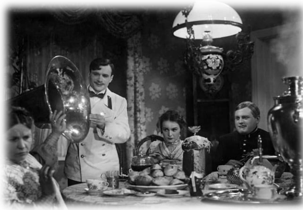
Кадр из фильма «Дело Артамоновых», 1941 год