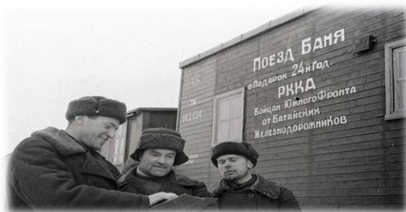
Рис.1. Вагон банно-прачечного и дезинфекционного поезда

К концу 1941 года на вооружение Красной армии стали поступать специальные банно-прачечные и дезинфекционные поезда (БПДП), в которых за час могли пройти обработку до сотни бойцов. Состояли такие поезда из 14-18 вагонов: раздевалок, формалиновых камер, душевых, прачечных и сушилок. Паровоз же обеспечивал паром и горячей водой весь этот банно-прачечный комбинат.