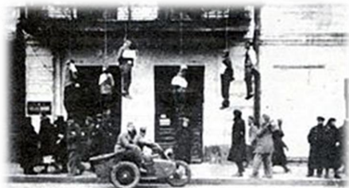
Рис. 2. Виселицы на балконах улицы Сумской.

В записи Абакумов делал выводы из показаний допрошенных гитлеровцев, которые участвовали в этих зверских массовых убийствах. Бывший сотрудник тайной полевой полиции Рейнгард Рецлав рассказывал, что ему приходилось принимать полное участие в загнании в «душегубки» советских граждан, находившиеся в Харьковской тюрьме. Как отмечал Рецлав, ему сначала показалось, что не более 30 человек уместится в кузове «душегубки».