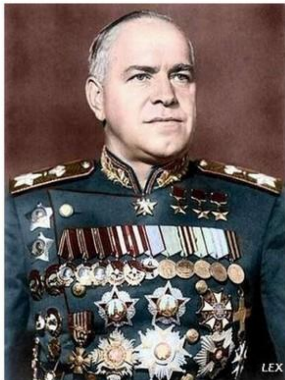
Маршал Советского Союза Г.К. Жуков