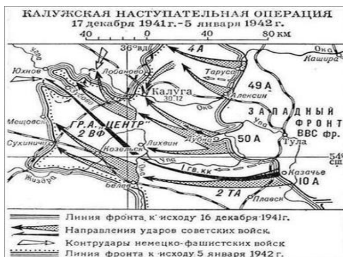
Рис.1 Схема Калужской наступательной операции

В декабре 1941 года штаб Западного фронта проводил серию наступательных операций. Им потом дадут общее наименование «Контрнаступление советских войск под Москвой». Тогда, в декабре, у каждой операции было свое название: Калининская, Клинско-Солнечногорская, Тульская, Елецкая, Детчинская. Одной из них, и довольно значительной, стала Калужская наступательная операция. Она явилась одним из наиболее успешных сражений Красной Армии в ходе ее контрнаступления под Москвой.